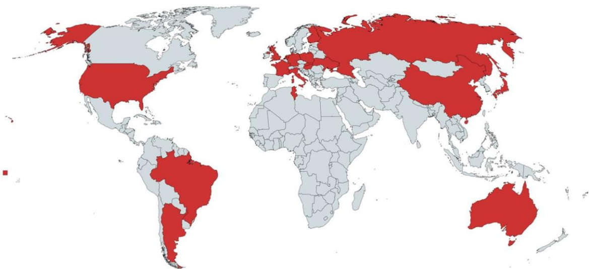
A 2021/2022-es projekt szerzőinek országai

2021/2022-es projektünk az orosz történetet taglaló nemzeti történetírásokról mind az öt földrész 18 országából nyert meg résztvevőket.