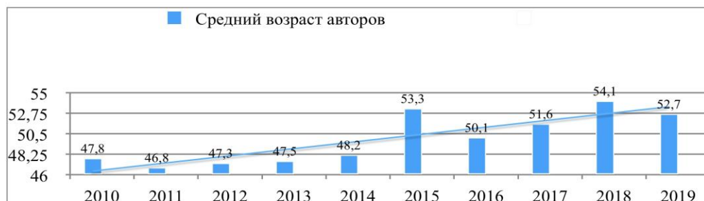
Рис. №4 Средний возраст авторов

В целом, научное сообщество и заинтересованная публика ежеквартально получает качественное, многогранное содержание, журнал международного уровня в привлекательном формате. Издание последовательно знакомит читателей с результатами исследований не только местного значения, но и с вопросами, соответствующими международным тенденциям исторической науки, а также классическими образцами научных исследований зарубежных авторов. В значительной степени расширяет коммуникативное пространство и ресурсность издания наличие сайта журнала, который позволяет осуществлять тематический поиск среди статей. Англоязычная версия сайта и перевод аннотации каждой статьи позволяет журналу стать частью международного экспертного пространства и продолжить важную и нужную работу по популяризации российской исторической науки.